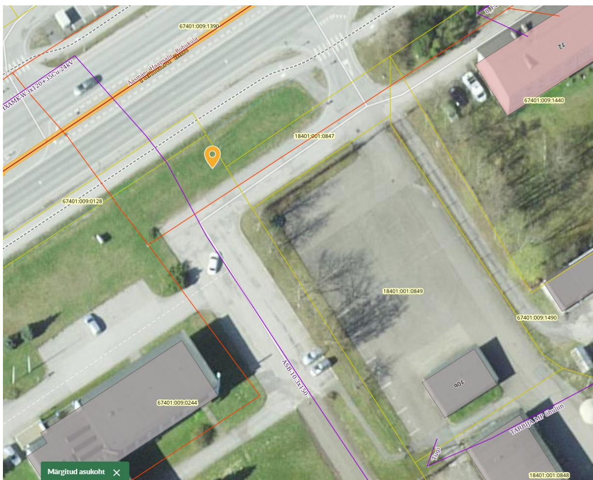
Joonis 1. AS Terminal Haapsalu automaattankla hinnaposti asukohaskeem (X 6533371.02 Y 475600.54)